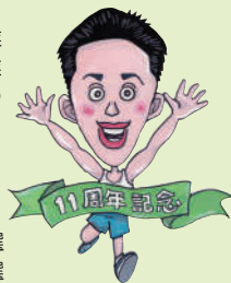
2011年4月初当選から11年を迎えます

1976年11月 鈴鹿市に生まれる 現在45歳(妻、長男、長女 4人家族) 1989年3月 鈴鹿市立白子小学校 卒業 1992年3月 鈴鹿市立鼓ヶ浦中学校 卒業 1997年3月 国立鈴鹿工業高等専門学校電気工学科 卒業 1999年3月 国立豊橋技術科学大学電気・電子工学課程 卒業 1999年4月 国立サウスバンク大学 英国留学(聴講生留学) 2001年10月 内閣官房職員 2008年3月 慶應義塾大学大学院 経営管理研究科 修了 2008年3月 アイシン精機株式会社経営企画室入社 2011年4月 三重県議会議員選挙(鈴鹿市選挙区)初当選 2015年4月 三重県議会議員選挙(鈴鹿市選挙区)2期目当選 2019年4月 三重県議会議員選挙(鈴鹿市選挙区)3期目当選 2019年6月 四日市港管理組合議会 議長 2021年5月 三重県監査委員(現職) 2021年11月 在職10年以上による自治功労者表彰を受賞