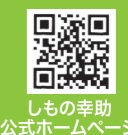
しもの幸助公式ホームページ

最新の活動状況がご覧いただけます 皆様からのご意見をお待ちしています。 お気軽にご連絡ください。