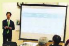
第180回2019年3月3日 鼓ヶ浦公民館

定期的に地元の皆様に三重県議会の活動状況などを報告しています。お気軽にご参加ください。 ※詳しくは「しもの幸助」事務所までお問い合わせをお願いします。