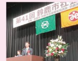
11月16日 第41回鈴鹿市社会福祉大会(鈴鹿市文化会館)