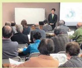
2018年12月2日 第168回県政報告会(鈴鹿市労働福祉会館)の模様