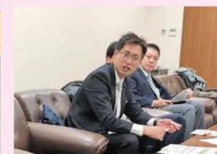
11月27日 横浜市会(外国人の受け入れ制度に関する調査)