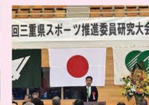
11月10日 第59回三重県スポーツ推進委員研究大会(三重交通グループ スポーツの杜)