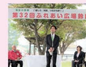
10月13日 第32回ふれあい広場鈴鹿(弁天山公園)