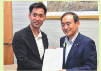
7/5 官房長官へ要望書を提出

2016年11月14日に中部国際空港拡充三重県議会議員連盟を発足し、愛知県・岐阜県・名古屋市の各議会とともに中部国際空港拡充を推進しています。2027年度のリニア中央新幹線名古屋開業に伴う5千万人リニア大交流圏の誕生を見据え、中部国際空港二本目滑走路の整備について早期の実現を図るべく、必要な調査検討を行うとともに、道路を始めとする空港へのアクセス網の充実に向け、積極的に取り組まれるよう国へ要望しています。