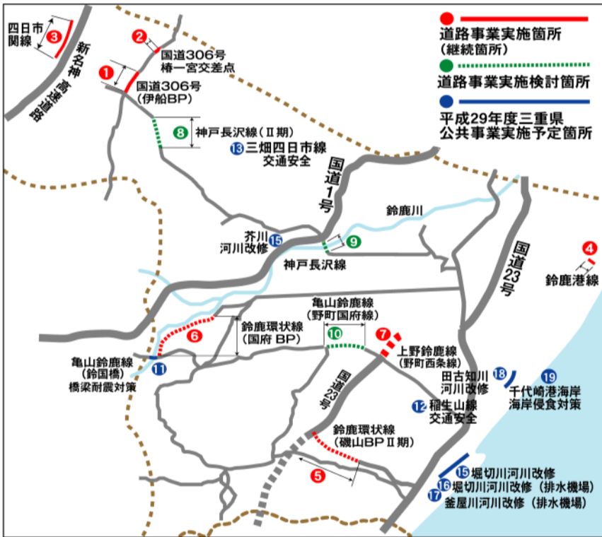
■平成29年度三重県道路事業実施箇所(継続・新規着工箇所) (単位:千円)