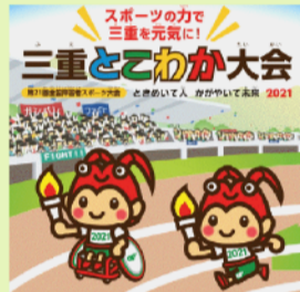
2021年三重とこわか大会（全国障がい者スポーツ大会）