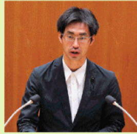
6/30 委員長報告（本会議場）