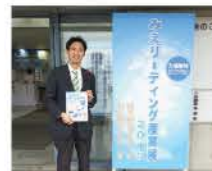
みえリーディング産業展

先端分野から地域密着型の産業まで、多彩な企業・団体が一堂に会して魅力発信と交流を行う三重県内最大級の規模を誇る展示会で、2日間(11/20、11/21)で4815名が来場されました。