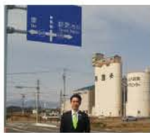
磯山バイパス視察

鈴鹿市南部の主要な東西道路である磯山バイパス1期工事(1.8km)が完了しました。継続して2期工事(鈴鹿ライスセンターから中勢バイパス:1.7km)開通を目指して、地域の皆様とともに取組んで参ります。