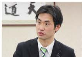
2015年12月8日総括的質疑

「みえ森と緑の県民税」は、「災害に強い森林づくり」と「県民全体で森林を支える社会づくり」を進めるため、平成26年4月1日に導入されました。平成28年度は「災害に強い森林づくり推進事業」で7億2千万円、市町交付金事業「みんなで支える森林づくりの推進」で4億6百万円の合計11.6億円の予算要求がありますが、市町交付金事業について林業振興のための間伐や獣害対策など市町の実態に応じた多様な事業展開が可能となるよう要望しました。