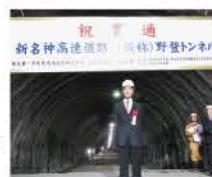
野登トンネル貫通式

2018年度開通予定の新名神高速道路(新四日市JCT~亀山西JCT:約23km)の一部となっている野登トンネル(仮称)貫通式が行われました。片側2車線、延長は約4.1kmの県内最長トンネルとなる予定です。鈴鹿PAスマートインターを含め、2018年度開通を目指して取組んで参ります。