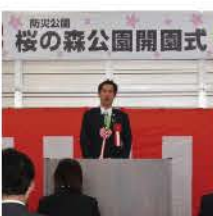
桜の森公園開園式

「桜の森公園」は7.3haの広大な公園で、野球場、自由広場、遊具も多数あり、多くの皆様が楽しめる公園となっています。また、防災対策として緊急時にはヘリポート2か所のスペースを確保しています。公園のとなりには鈴鹿市の戦争遺跡を保存・平和利用するモニュメント「地・天」も設置されました。