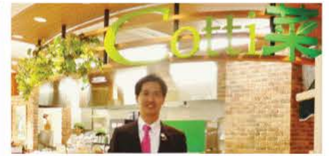
障がい者雇用推進 ステップアップカフェ「Cotti菜(こっちな)」 2015年12月23日一周年記念

平成25年 1.60% (全国47位) ↓ 伸び率(全国2位) +0.19% 平成26年 1.79% (全国33位) ↓ 伸び率(全国1位) +0.18% 平成27年 1.97% (全国20位)