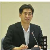
特別委員会委員長就任

三重県人口は181万人(2015年8月現在)から2040年には150万人程度になると推計されています。そのため、三重県議会では当委員会を設置し、重点調査項目を①持続可能なしごとの創出②地域への理解と愛着を育むキャリア教育③移住の促進の3点に絞り、協議しています。また、9月4日には三重県知事へ提言書を提出しています。