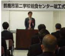
給食センター竣工式

2015年5月から鈴鹿市内の市立中学校10校(約6,500食分)は給食となりました。給食センターでは地場産物の活用と地産地消の推進及び郷土色や伝統行事にちなんだ献立を学校給食に採り入れ、子どもたちの食文化の理解を深めるよう取り組まれています。