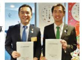
2015年12月8日知事へ要望