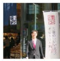
三重テラス2周年記念

三重の魅力発信の首都圏営業拠点「三重テラス」は三重の豊かな自然、歴史、文化、食などの観点から、さまざまな魅力満載のイベントを開催しています。その三重テラスが9月28日にオープン2周年を迎え、12月に来館者も130万人を突破しました。継続的な首都圏と三重県のつながりを大切に運営を支援していきます。